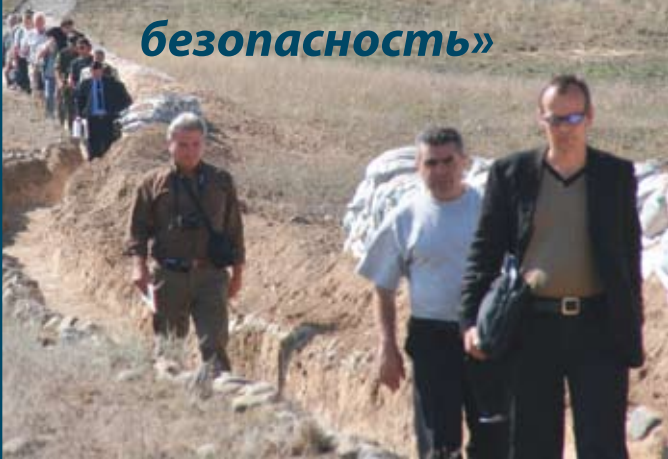
Нагорнокарабахский регион. Эксперты руководимой ОБСЕ миссии экологической оценки возвращаются с инспектируемого объекта.

Осуществление инициативы ЭНВСЕК стало возможным благодаря добровольным взносам, поступающим, в частности, от Австрии, Бельгии, Венгрии, Германии, Испании, Италии, Канады, Нидерландов, Норвегии, Соединенных Штатов, Финляндии, Чешской Республики, Швейцарии и Швеции.