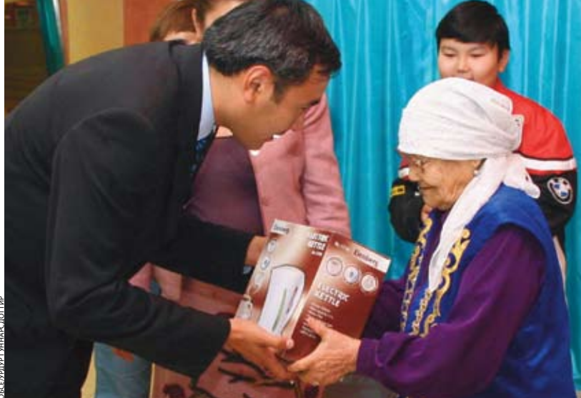
ОБСЕ/УРГ ГУНАС ДОПТИР