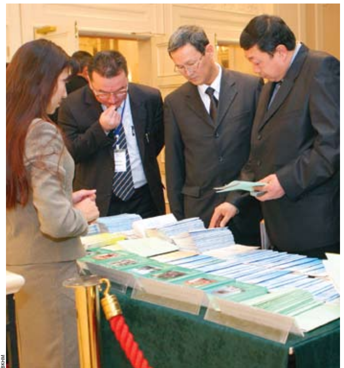
Работники образования Центральной Азии: “Мы отлично знаем проблемы друг друга”.