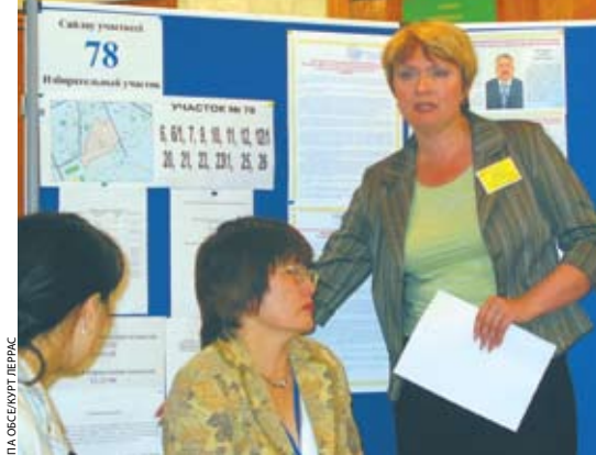
ПА ОБСЕ/УРГ ЛЕРНАС