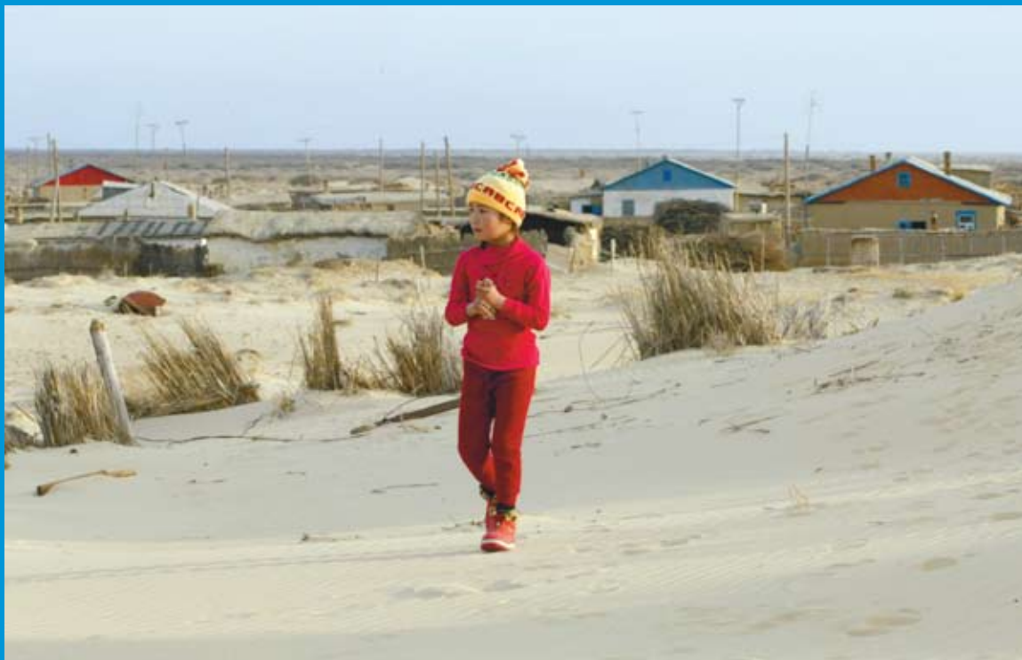
“Живущие на дне моря” фотографа Шамиля Жуматова из Казахстана. Жители рыбацких поселков у Аральского моря, где произошла крупнейшая экологическая катастрофа региона, надеются на лучшие времена

Организация по безопасности и сотрудничеству в Европе