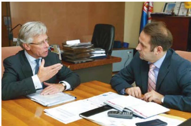
Белград, 10 сентября 2007 года. Во время своего первого — после назначения на пост Верховного комиссара ОБСЕ по делам национальных меньшинств — официального визита в Сербию, посол Кнут Воллебек встречается с Рашиско Льяжичем, президентом координационного органа Южной Сербии.

“То было время, когда усугубляемые межэтнической напряженностью кризисы возникали в регионе с необыкновенной быстротой и мощностью”, — говорит посол Воллебек. Стоя у кормила организации, он сыграл ключевую роль в поисках мирного урегулирования косовского кризиса в преддверии войны, а позже — в реконструкции и восстановлении Косово, через создание там Присутствия ОБСЕ.