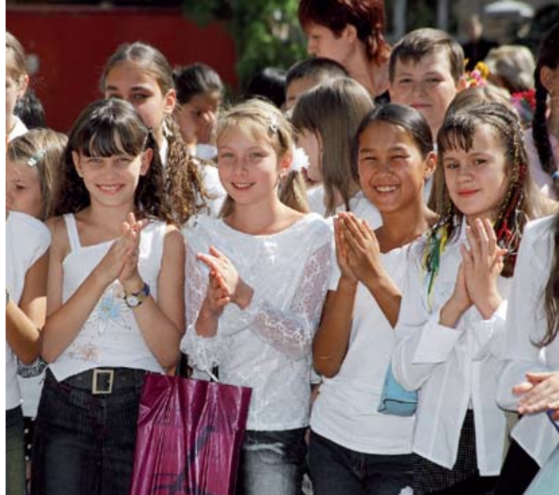
Школы Кыргызстана отличаются богатым этническим многообразием