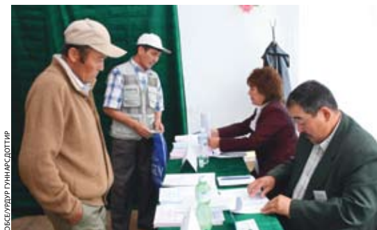
ОБСЕ/УРГ ГУНАС ДОПТИР