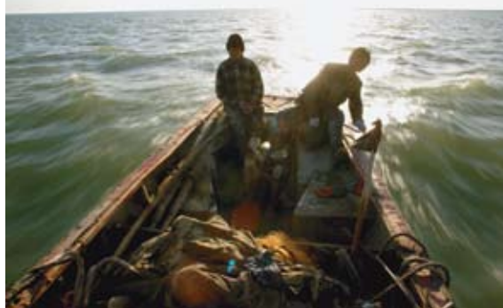
В 2006 году «Нью-Йорк таймс» проиллюстрировала свою статью об Аральском море этой сделанной Шамилем Жуматовым фотографией рыбаков вблизи поселка Каратерен.

Победившие на конкурсе снимки представлены на веб-сайте ОБСЕ. Они также выставлялись на 15-й встрече Экономико-экологического форума ОБСЕ, состоявшейся 21–23 мая 2007 года. Основными тематическими аспектами этого проведенного в Праге фотоконкурса были деградация земельных ресурсов, загрязнение почвы и управление водными ресурсами.