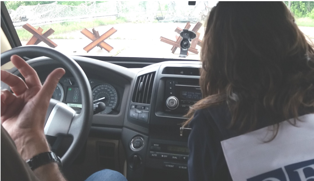
Свобода передвижения наблюдателей СММ оставалась ограниченной, в том числе и из-за наличия мин и неразорвавшихся боеприпасов.