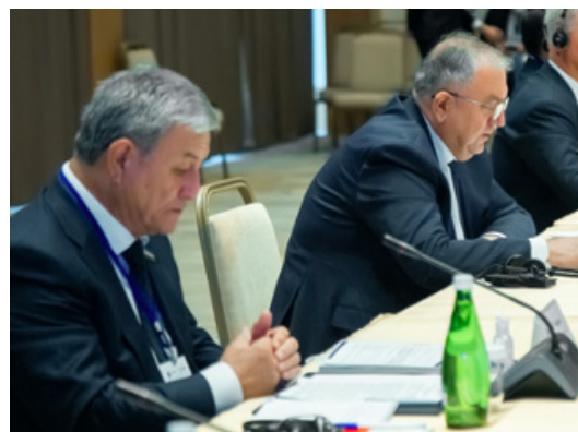
Фото: высокопоставленные члены президиума выступают с приветственным словом (слева направо): г-н Нариман Умаров, Председатель Комитета по судебным вопросам и противодействию коррупции Олий Мажлиса Республики Узбекистан; г-н Козимджан Камилов, Председатель Верховного суда Республики Узбекистан

Г-н Джураев также сообщил, что в Узбекистане большое внимание уделяется внедрению современных информационных технологий в деятельность судов. В частности, в стране разработана электронная система под названием E-XSUD, 26 в которой хранится информация о местоположении судов, дате и времени рассмотрения всех судебных дел, также предусмотрена возможность ознакомления с любым судебным решением. Среди других технологических новшеств: автоматическое распределение дел во всех судах, извещение участников о времени и месте судебного заседания путем отправки СМС-сообщений на бесплатной основе, аудиозапись слушаний и внедрение системы видеоконференций для дистанционного участия в слушаниях.