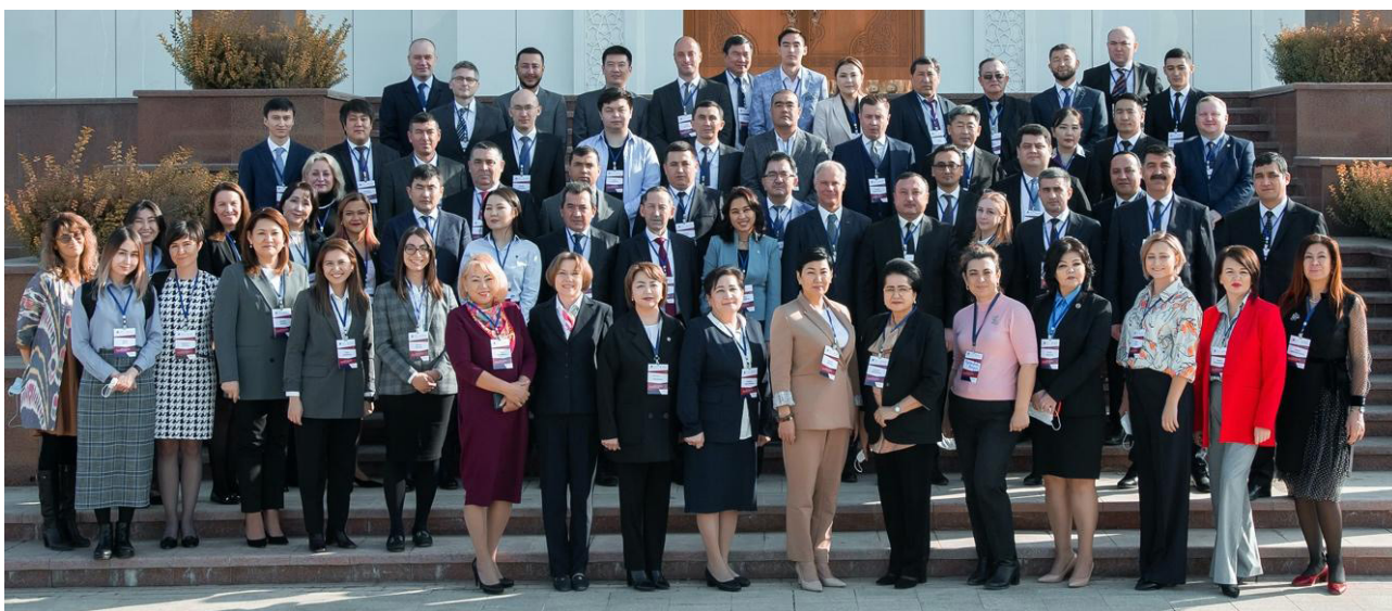
Фото: участники Восьмого экспертного форума по уголовному правосудию для Центральной Азии, 24-25 ноября 2021 г., Ташкент, Узбекистан

Экспертный форум по уголовному правосудию для Центральной Азии служит площадкой для обмена знаниями и опытом между заинтересованными сторонами в системе уголовного правосудия и способствует информированному диалогу между ними с целью реформы уголовного правосудия и разработки политики. Форум проводится Бюро по демократическим институтам и правам человека ОБСЕ (БДИПЧ ОБСЕ) в партнерстве с Управлением ООН по наркотикам и преступности (УНП ООН) и Управлением Верховного комиссара ООН по правам человека (УВКПЧ) с 2008 года в рамках программы по верховенству права. Впервые форум был проведен в Зеренде (Казахстан) в 2008 году, после чего последовали форумы на Иссык-Куле (Кыргызстан) в 2009 году, Душанбе (Таджикистан) в 2010 году, 1 Алматы (Казахстан) в 2012 году, 2 Бишкеке (Кыргызстан) в 2014 году 3 , Ташкенте (Узбекистан) в 2016 году 4 и в Бишкеке (Кыргызстан) в 2018 году. 5