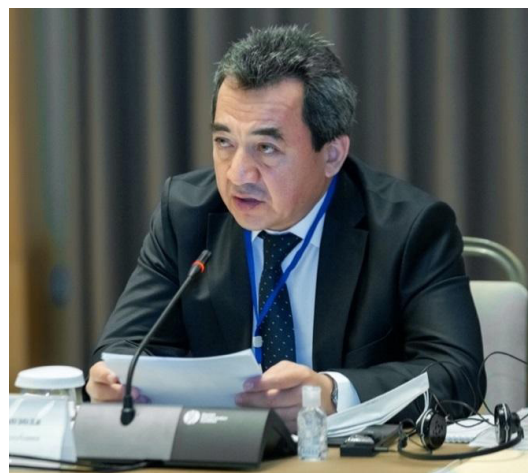
Фото: Абдуманнон Додозода, Судья, Верховный Суд Республики Таджикистан

Г-н Абдуманнон Додозода, судья Верховного суда Республики Таджикистан, сообщил участникам Форума о ключевых реформах, реализованных в сфере уголовного правосудия в стране с момента обретения независимости. В частности, в 2004 году был объявлен мораторий на исполнение смертной казни, вместо нее в качестве меры наказания исполняется пожизненное лишение свободы. Помимо этого, были декриминализованы клевета и словесные оскорбления. Были предприняты дополнительные меры по гуманизации уголовного законодательства. В частности, если лицо, совершившее экономическое преступление, возместит весь нанесенный ущерб до того, как будет вынесено решение суда, он или она не могут быть приговорены к лишению свободы.