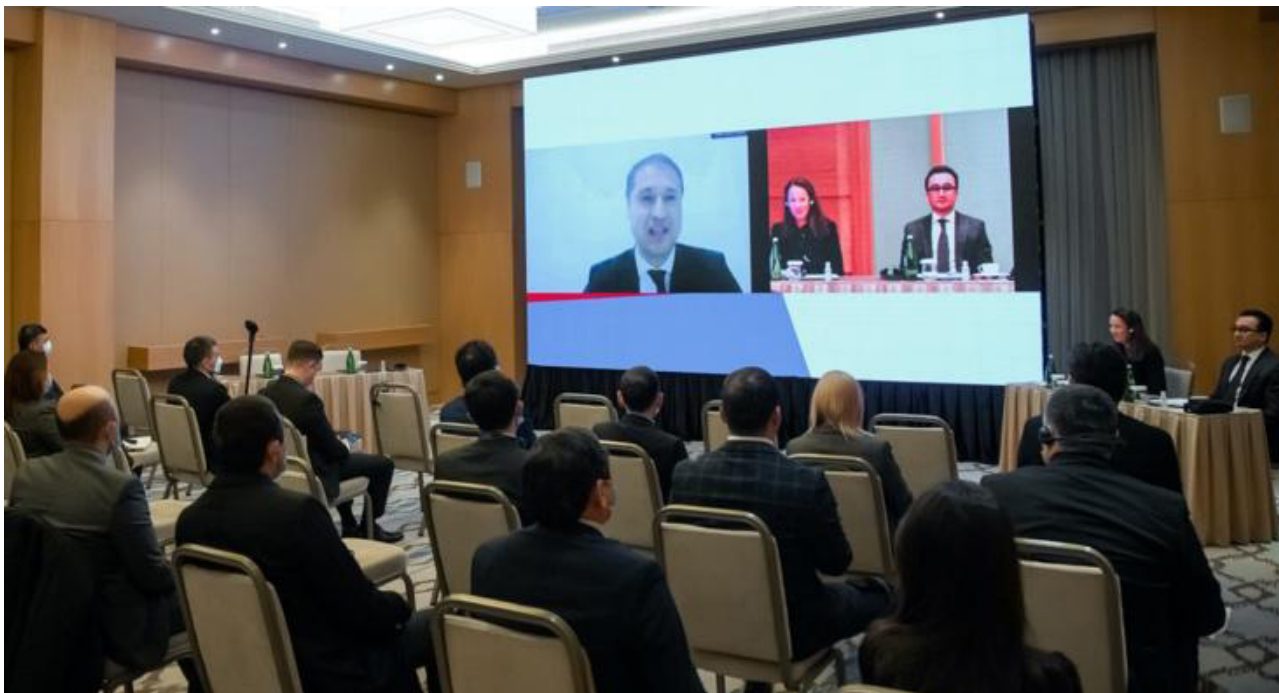
Фото: параллельное мероприятие «Мониторинг судебных процессов: извлеченные уроки и передовая практика», организованное Верховным Судом Республики Узбекистан и Бюро ОБСЕ по демократическим институтам и правам человека (БДИПЧ)

Систематичный мониторинг судебных процессов помогает выявить слабые и сильные стороны системы правосудия и составить дорожную карту рекомендаций по ее дальнейшему совершенствованию. Тематический мониторинг позволяет изучить, как на практике применяется недавно принятое законодательство (например, новые процессуальные кодексы), в то время как специальный мониторинг слушаний по рассмотрению отдельных резонансных или политически значимых дел служит инструментом общественного контроля.