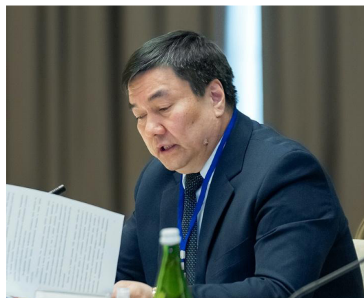
Фото: г-н Кынатбек Сманалиев, Заместитель Министра юстиции Кыргызской Республики

Г-н Кынатбек Сманалиев, Заместитель Министра юстиции Кыргызской Республики, сообщил, что в 2021 году Кыргызстан принял поправки к Уголовному кодексу 14 Уголовно-процессуальному кодексу, 15 и Кодексу о правонарушениях, 16 также были внесены существенные изменения 17 в Уголовно-исполнительный кодекс, Закон о пробации и другие законы. Новые кодексы вступили в силу 1 декабря 2021 года.