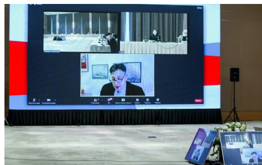
Фото: г-н Дуро Сесса, Президент Европейской ассоциации судей, судья Верховного Суда Республики Хорватия (онлайн-подключение)

Судья из Хорватии отметил, что пандемия поставила суды в сложное положение. С одной стороны, они должны защищать здоровье населения (в том числе сотрудников), по мере возможности ограничивая