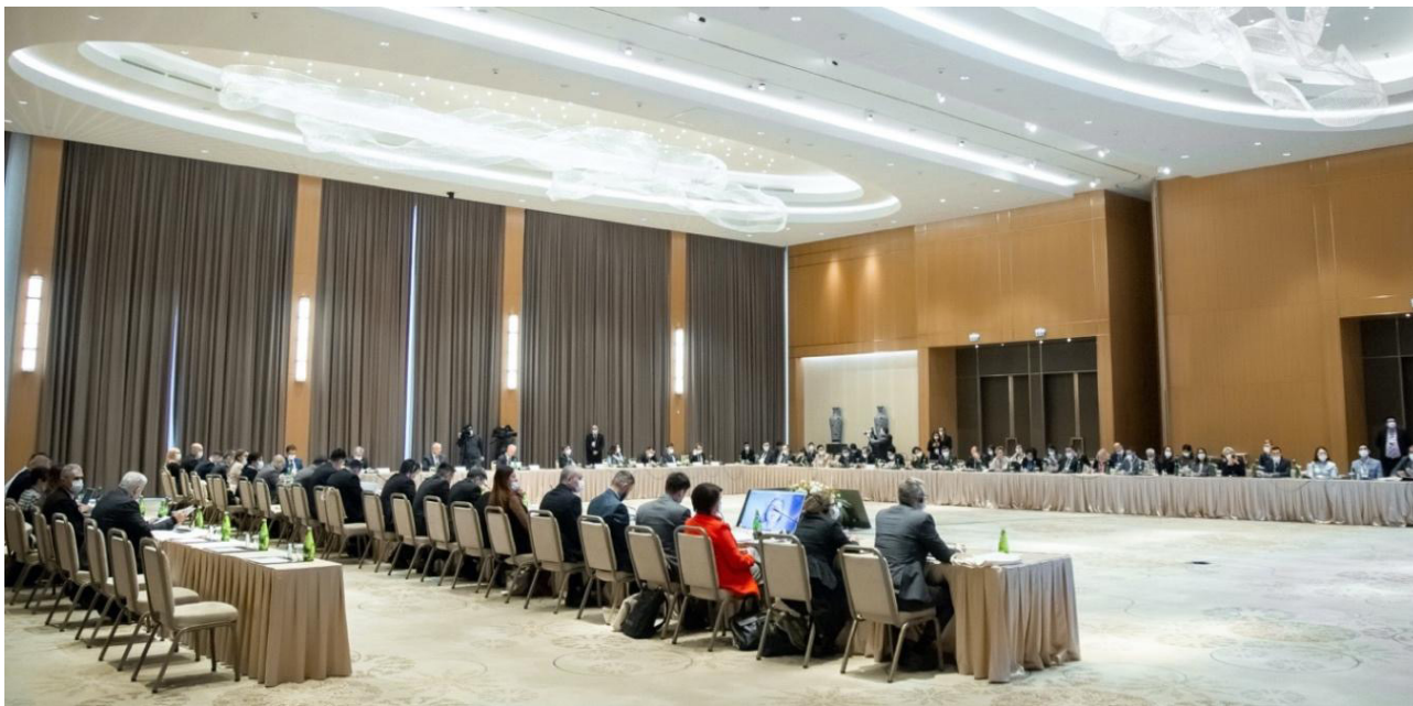
Фото: зал пленарных заседаний Восьмого экспертного форума по уголовному правосудию для Центральной Азии, 24-25 ноября 2021 г., Ташкент, Узбекистан

В мероприятии участвовали эксперты с разнообразным опытом в области уголовного правосудия из Австралии, Хорватии, Эстонии, Северной Македонии, Польши, Португалии, Швеции, Великобритании и Украины, которые рассказали о практике других стран за пределами региона Центральной Азии.