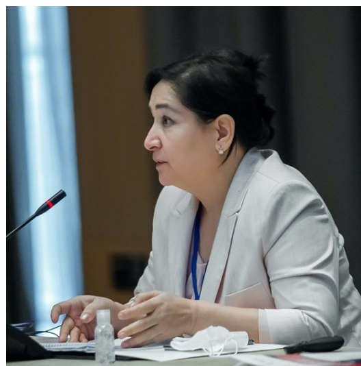
Фото: г-жа Санобар Мамадалиева, Судья, Верховный суд Республики Узбекистан

В основу мероприятия легли обсуждения, состоявшиеся в ходе завтрака «Женщины и правосудие» на Экспертном форуме 2018 г. в Бишкеке. На той встрече было поддержано мнение о необходимости активного содействия созданию большего числа ассоциаций женщин-судей в Центральной Азии. 84 После этого в апреле 2021 года БДИПЧ был организован вебинар, в рамках которого освещалась рекомендуемая практика создания таких ассоциаций и их основные преимущества. 85 Участники отметили важную роль международных диалоговых площадок, так как они позволяют обсудить вопросы создания ассоциаций женщин-судей. Наряду с Кыргызстаном, где функционирует Кыргызская ассоциация женщин-судей (КАЖС), другие государства Центральной Азии также ведут работу в этом направлении. В некоторых были созданы отделения женщин-судей в составе общих ассоциаций судей. Деятельность международных ассоциаций женщин-судей, в частности региональных, особенно важна для обмена опытом и рекомендациями по дальнейшему развитию.