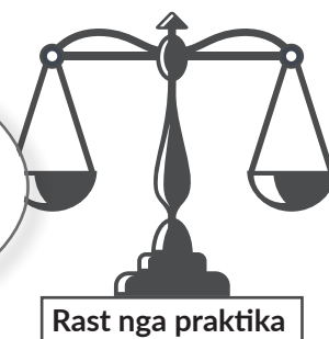
Rast nga praktika