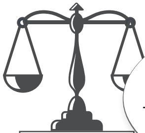
Rast nga praktika

Në mënyrë plotësuese shqetëson fakti se shpeshherë në shtetin tonë trafikantët me qenie njerëzore janë të gjinisë femërore.