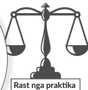
Rast nga praktika

I akuzuari është shpallur për fajtor për veprën penale trafikim me qenie njerëzore meqë gjatë vitit 2007, për përfitim personal financiar e ka shfrytëzuar gjendjen e vështirë financiare të fëmijës VTQNJ në atë mënyrë që i ka dhënë para hua me obligim që të kthej një shumë më të lartë. Kur fëmija VTQNJ nuk ka pasur para të mjaftueshme për ta kthyer borxhin, i akuzuari e ka detyruar të merret me bixhoz dhe vjedhje. Gjatë procedurës është përcaktuar se viktima ka qenë inferiore në raport me të akuzuarin duke e pasur parasysh moshën e tij, papjekurinë emocionale dhe nivelin e ulët të inteligjencës. Megjithatë, viktima ka qenë e vetëdijshme se mund të ketë pasoja nëse nuk vepron në pajtim me urdhrat dhe udhëzimet e të akuzuarit për kryerjen e veprave penale.