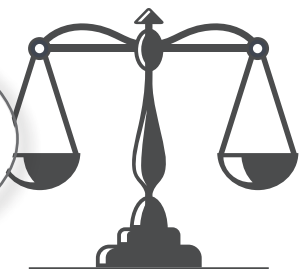
Rast nga praktika

Viktima është shitur nga tezza e saj, me qëllim që të lidhë martesë me trafikantin. Trafikanti i ka premtuar vajzës se do të dalin jashtë vendit dhe atje do të punojnë. Trafikanti ka siguruar dokument udhëtimi të falsifikuar për veten e tij dhe për fëmijën viktimë, por është zbuluar në kufi gjatë tentativës që ta fus viktimën në shtetin tonë.