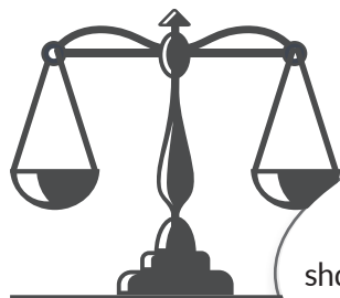
Gjetjet e personit ekspert në lidhje me VTQNJ

KP nuk i precizon rrethanat e tjera lehtësuese për shkak të të cilave kryerësi mundet edhe të lirohet nga dënimi. Ky nocion duhet të interpretohet në kontekstin e dispozitës për tejkalimin e mbrojtjes së nevojshme (neni 9 paragrafi 3): nëse tejkalimi është bërë për shkak të lemerisë ose për shkak të ndonjë gjendje të ngjashme psikike e shkaktuar nga rreziku.