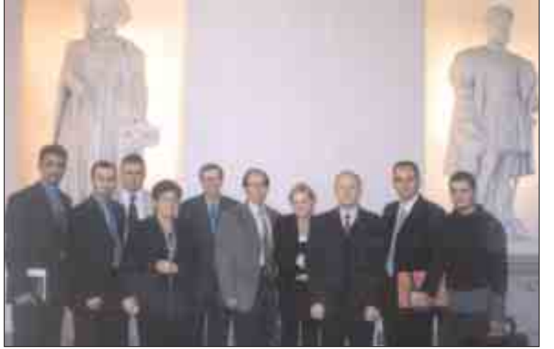
Kosova Delegasyonu Briksel'deki Belçika Parlamentosuna yapmış olduğu ziyareti esnasında.