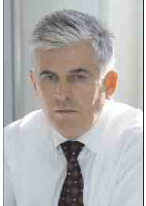
Başbakan Bajram Rexhepi

Dördüncü – Bunların dördüncü boyutu politik nitelikte olacaktır, çünkü sözü geçen yasalar Kosova'nın arzu edilen hedefe ulaşmasında rehberlik yapacaktır;