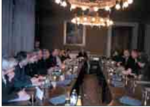
Kosova Meclisi komisyonlarının temsilcileri Avusturya Parlamento'su iş arkadaşlarıyla bir araya geldiler

Yıllarca Avusturya Parlamento'su Başkanı ve şimdi de Başkan Yardımcısı olan Sayın Heinz Fischer, ile görüşme özel bir ağırlık taşıyordu. Konuşmasının başlangıcında Sayın Fischer, Kosova Meclisi ve AGİT'in çağrısı üzere 2002 yılında Kosova'ya yapmış olduğu ziyareti