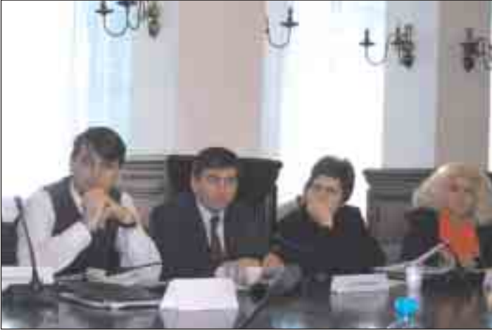
Ayrımcılığa Karşı Kanun ve Cinsiyet Eşitliği Kanun hakkında ortak açık oturum