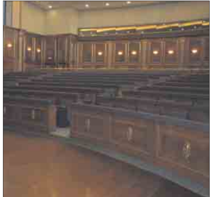
Onarılan Meclis holünden bir görüntü

2003 Kasım ayının ortasından 2004 yılının sonu arasında, Meclis birkaç kanunu gözden geçirip onayladı. Bazı kanunlar sözü geçen tarihte ikinci görüşmeden sonra onaylandı. Tarihi olmayan kanunlar ilk görüşmede sadece tasdiklenerek – Ocak ayının sonunda – hala Meclis Komisyonları tarafından görüşülme safhasında bulunmaktadır: Sporlar Kanunu (21.11.2003), Kadastro Kanunu (04.12.2003), Karayolları Taşımacılığına Değın Kanun (15.01.2004), Cinsiyet Eşitliğine Değın Kanun Tasarısı, Ayrımcılığa Değın Kanun Tasarısı, Sağlığa Değın Kanun Tasarısı, Eski Yugoslavya'ya dair Uluslararası Suç Mahkemesi ile İşbirliğine Değın Kanun Tasarısı (ICTY), Ticaret Odasına Değın Kanun Tasarısı, Kosova'da Petrol ve Petrol Ürünlerinin Ticaretine Değın Kanun Tasarısı, Sinematografiye Değın Kanun Tasarısı.