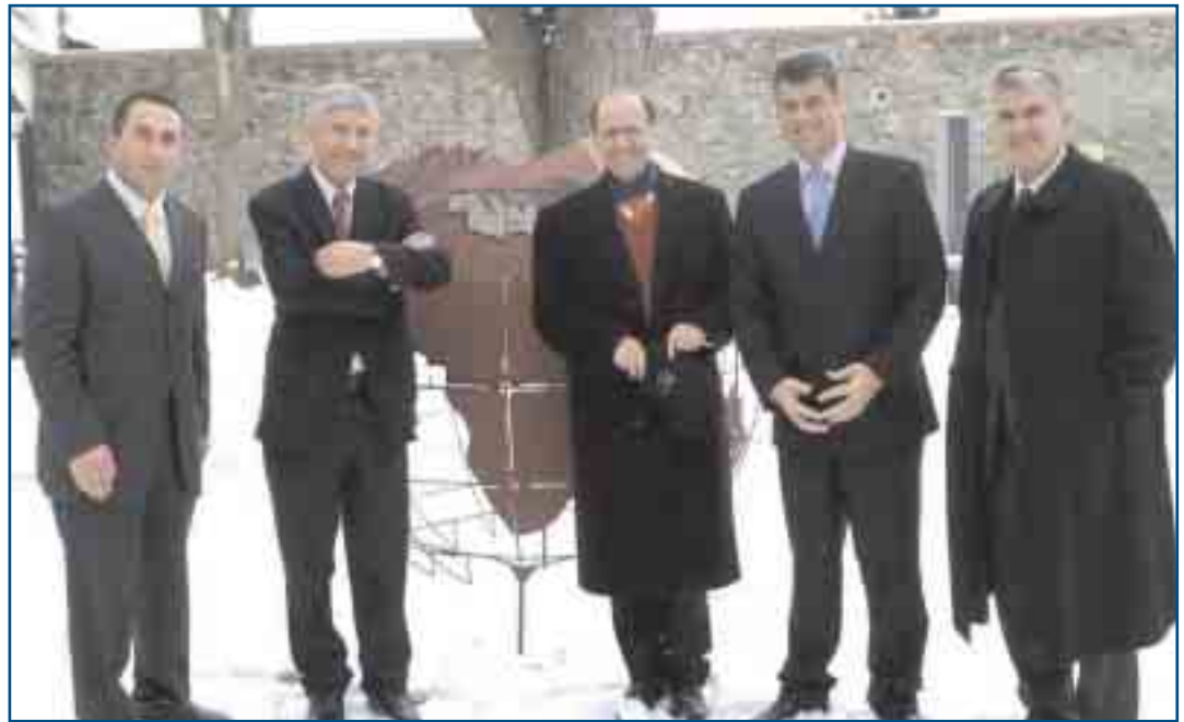
Burg Şlaining şatosunda: Sayın Ramuş Haradinay, Sayın Necat Daci, Sayın İbrahim Rugova, Sayın Haşim Taçi ve Sayın Bayram Reçepi.

Kışın hüküm sürdüğü ortamda Burg Schlaining Şatosu'nda düzenlenen bu toplantıdan alınan nihai ders şudur: Galiba istenilen hedefe varmak için "başarının sırrı" eski dönemlerdeki karşılıklı suçlama ve aşırı tutumlardan vazgeçip demokratik bir kompromis ruhunun samimi bir şekilde arzulanması ve istenmesinden geçmektedir. Toplantıya katılan herkesin gerçekten de yorulmak bilmeyen çabalarına teşekkür ederek, ileride de benzeri toplantıların düzenlenmesiyle katılımcıların kazançlı çıkacaklarını göstermektedir.