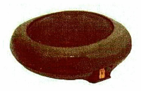
Mina antipersonal modelo P-5