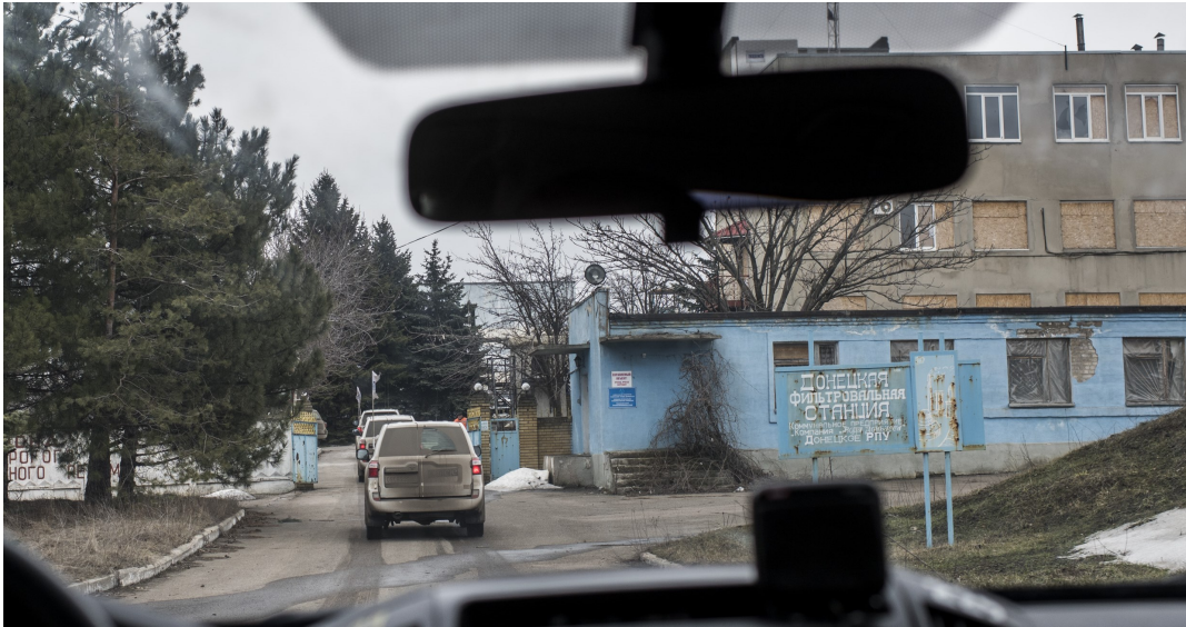
Патрулювання СММ ОБСЄ на Донецькій фільтрувальній станції, 2018 р.