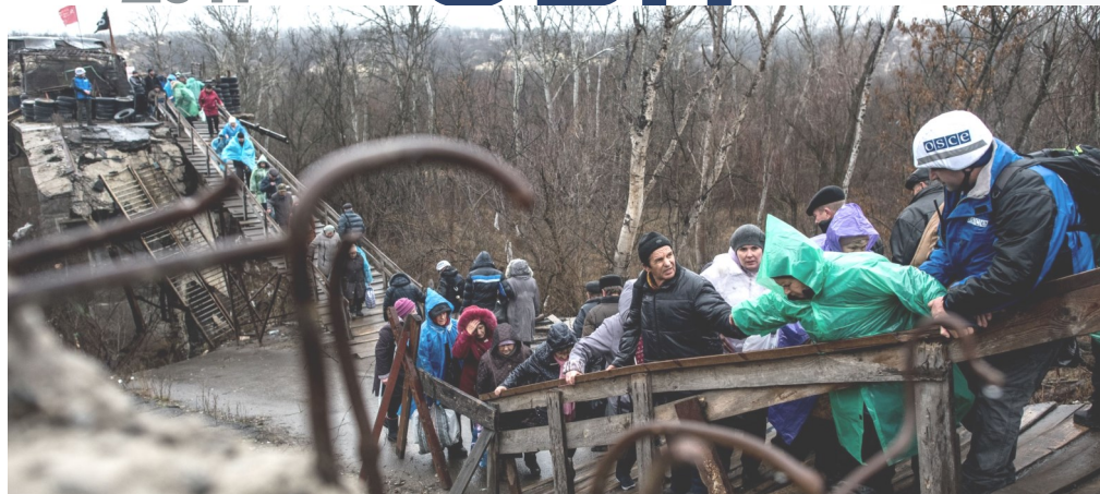
Спостерігач СММ ОБСЄ допомагає людям перейти через міст у Станиці Луганській, 21 листопада 2017 року.