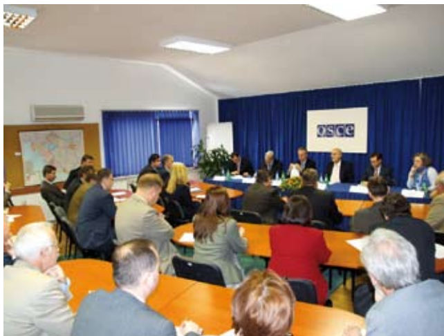
Sastanak veleposlanika država članica OESS-a i Misije OESS-a u Republici Hrvatskoj u glavnom uredu u Zagrebu, 11. travnja 2007.