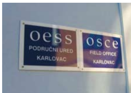
Ploče s natpisom Područni ured Karlovac

Ovo, te još mnogo toga što ova dva primjera tek djelomično opisuju, nasljeđe je Područnog ureda Karlovac. Kada je voditelj Misije, u pratnji slovačkog veleposlanika 29. ožujka govorio pred okupljenim predstavnicima grada Karlovca i županije te predstavnicima mnogih općina, nevladinih organizacija, manjinskih skupina i djelatnika Ureda, naglasio je kako zatvaranje Područnog ureda u Karlovcu nije znak neuspjeha, već znak uspjeha - uspjeha u ostvarivanju pozitivnih promjena na svom području odgovornosti, uspjeha u postizanju ciljeva, uspjeha u smislu dobro i vjerno obavljenog posla.