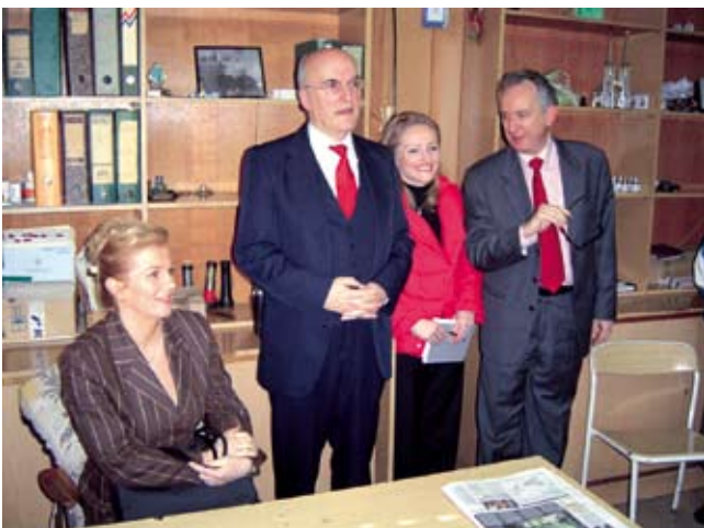
Kolinda Grabar-Kitarović, ministrica vanjskih poslova, voditelj Misije i Manuel Salazar, veleposlanik Španjolske, tijekom posjeta na terenu u Sisku, 12. ožujka 2007.