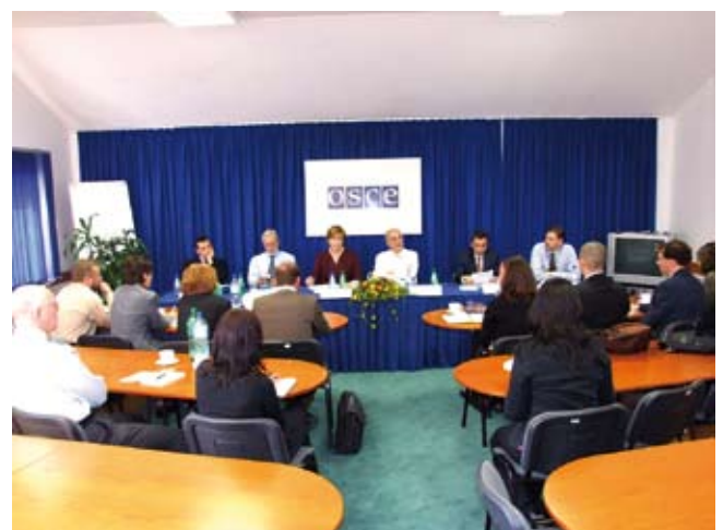
Sastanak rukovoditelja Misije u glavnom uredu u Zagrebu, 11. travnja 2007.