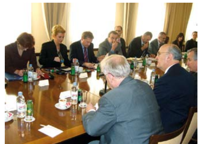
Jedan od mjesečnih plenarnih sastanaka u Ministarstvu vanjskih poslova u Zagrebu, 21. ožujka 2007.