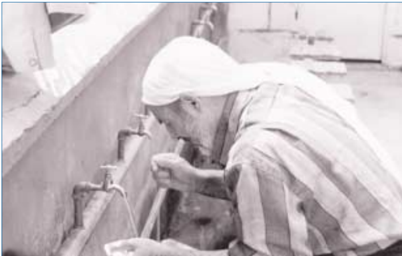
ДОСТУП К ВОДЕ: ОСНОВНАЯ НУЖДА

имеющего доступа к безвредной питьевой воде и адекватным санитарным условиям к 2015 году.