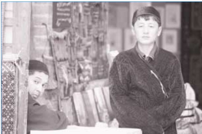
РЫНОК В БУХАРЕ, УЗБЕКИСТАН