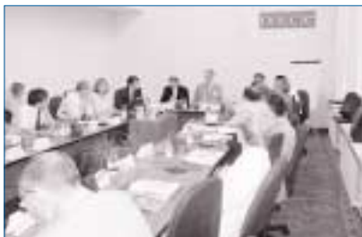
КОНФЕРЕНЦИЯ ПО ВОПРОСАМ СТАБИЛЬНОСТИ И БЕЗОПАСНОСТИ ПИТЬЕВОЙ ВОДЫ, АЛМА-АТЫ, ИЮЛЬ 2002 Г.

Каньон Чарин, 8 июня 2002 г. Целью мероприятия было очистить каньон Чарин и привлечь внимание к недостатку устойчивой политики относительно развития природных парков и экотуризма. Для того чтобы гарантировать деятельность в рамках дальнейших шагов, Центр ОБСЕ официально попросил Министерство охраны окружающей среды и природных ресурсов и Парламент Республики Казахстан разработать стратегический подход к устойчивому развитию туризма. Проект реализован в сотрудничестве с Региональным центром Средней Азии по охране окружающей среды. (2 000 долларов США; фонд главы Миссии).