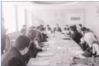
ТРЕНИНГ В КАЗАХСТАНЕ

Согласно инструкциям, изложенным в Приложении 11, Центр осуществляет деятельность, направленную на улучшение бизнес-климата, развитие малого и среднего бизнеса, предоставление женщинам возможностей участвовать в экономических вопросах и прав на собственность, содействие развитию надлежащей практики управления и прозрачности, увеличение кадрового потенциала в гражданском управлении. Центр продолжает сотрудничать с другими международными организациями. Центр будет продолжать проекты в области охраны окружающей среды, в частности проекты по Орхусской и другим международным конвенциям. Особое внимание уделяется управлению трансграничными водными ресурсами; продолжается осуществление проекта по вопросам рек Чу и Талас.