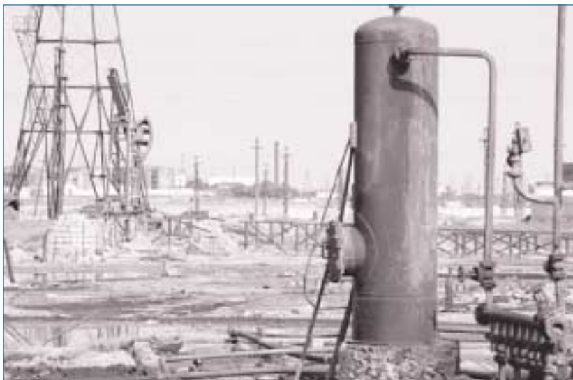
АЗЕРБАЙДЖАН. ДОБЫЧА НЕФТИ И ЗАГРЯЗНЕНИЕ

→ Дискуссии круглого стола в рамках дальнейших шагов к практикуму «Борьба с отмыванием денег и пресечение финансирования терроризма» 28–29 апреля 2003 г. Во время встречи обсуждался проект закона о борьбе с отмыванием денег. В обсуждении приняли участие эксперты, принимающие непосредственное участие в разработке законопроекта, а также международные эксперты, приглашенные ОБСЕ и Управлением ООН по контролю над наркотиками и предупреждению преступности. Проект реализован в сотрудничестве с Управлением ООН по контролю над наркотиками и предупреждению преступности (15 000 евро; США через БКДЭОС)