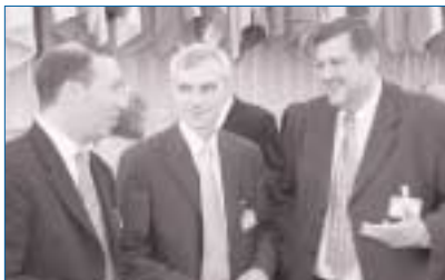
10-я ВСТРЕЧА ЭКОНОМИЧЕСКОГО ФОРУМА, ПРАГА, МАЙ 2002 Г.

Делая акцент на установление надлежащей государственной практики по управлению общими водными ресурсами Кыргызстана и Казахстана, проект, в первую очередь, оказывает помощь в разработке устава, правил и процедур работы совместной комиссии. Проект поддерживает выработку политического курса и развитие возможностей для обеспечения эффективной реализации соглашения. Также целя-