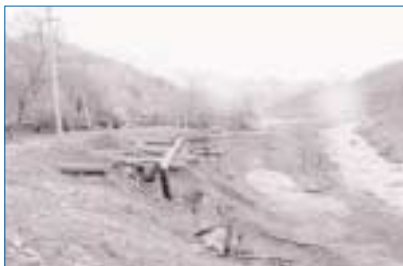
РАДИОАКТИВНЫЕ ОТХОДЫ В МАЙЛИ-САЙКОМ РАЙОНЕ

нец, в рамках Форума через депутатов Парламента ведется работа над законодательством Кыргызской Республики по вопросам экологии. Реализуется в сотрудничестве с ошским экологическим движением «Табият-Ош». (8 236 долларов США; правительство США)