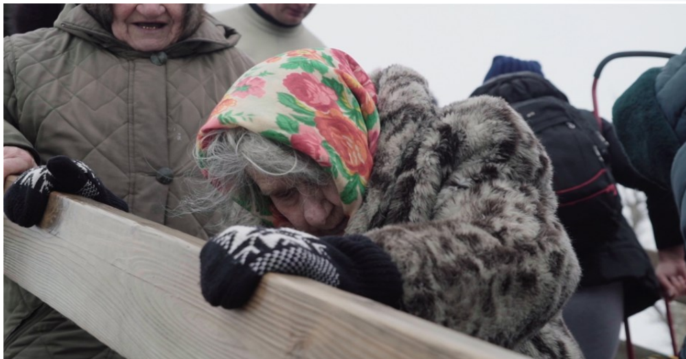
Гражданские лица пересекают контрольный пункт въезда-выезда возле Станицы Луганской, Луганская область