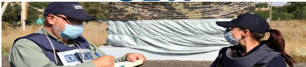
Спостерігачі СММ у Донецькій області