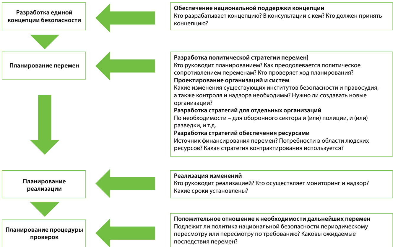
Рисунок 1: Контрольные вопросы для разработки нормативных документов по безопасности 3

основными субъектами реализации национальной политики в области безопасности.