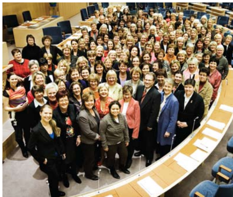
Женщины-депутаты риксдага со спикером Пером Вестенбергом в 2007 году. Швеция является второй после Руанды в мире страной по представленности женщин в национальном парламенте. Фото: шведский риксдаг/Мелькер Дальстранд

Источник: Межпарламентский союз http://www.ipu.org/english/home.htm