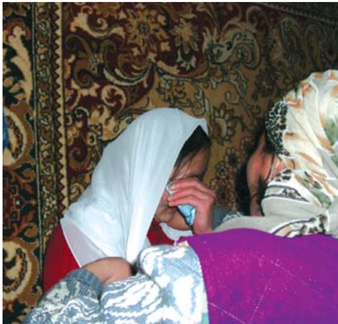
Нарын, Кыргызстан. Молодая женщина в слезах: ее похитили и насильно заставили покрыть голову платком невесты

Необходимость проведения новых исследований для выявления возникающих тенденций