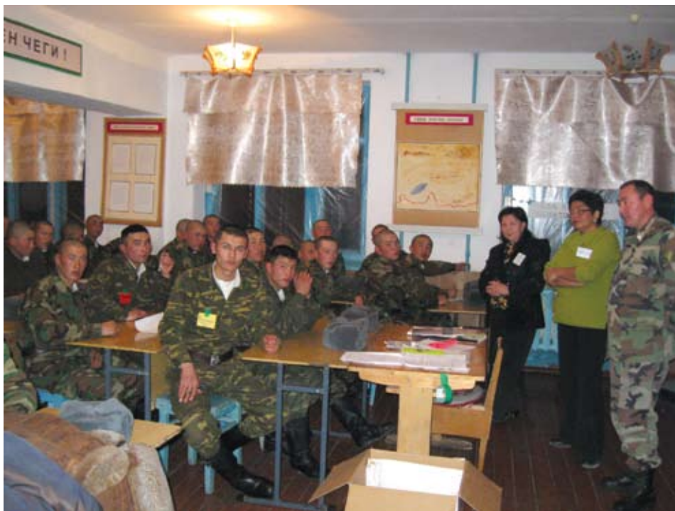
Город Нарын, 5 декабря 2008 года. По случаю проведения международной кампании по борьбе с насилием в семье, организованной при поддержке Центра ОБСЕ в Бишкеке, НПО «Бакубат» провела серию семинаров, в которых приняли участие 150 сотрудников пограничной службы Кыргызстана, представителей личного состава нарынского батальона министерства обороны, студентов-медиков и слушателей Педагогического училища и Нарынского государственного университета