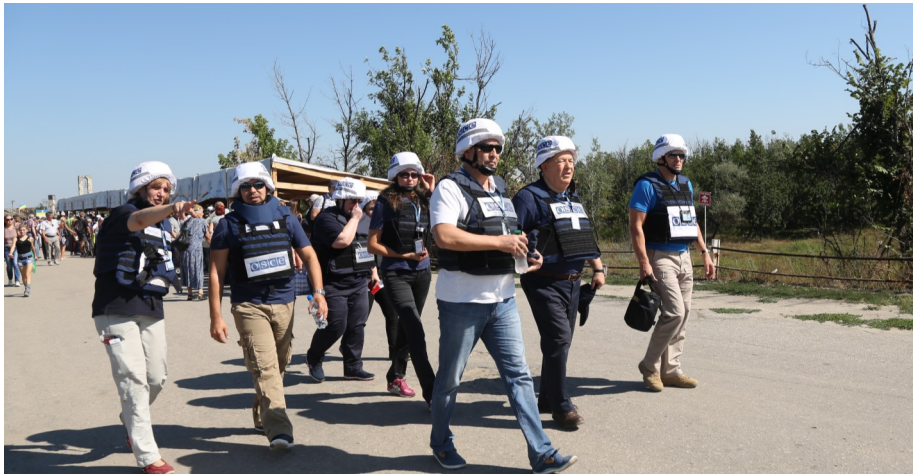
Глава СММ ОБСЕ с другими наблюдателями СММ на контрольном пункте въезда-выезда в Станице Луганской, Луганская область, 29 августа 2016 года.