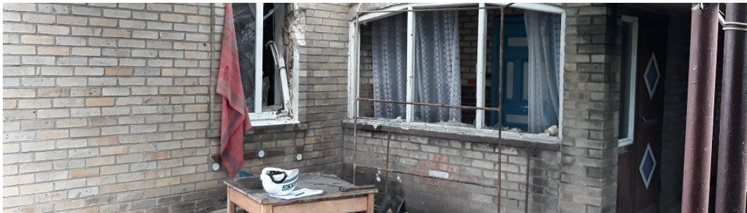
Пошкоджена внаслідок обстрілу оселя в Олександрівці Донецької області, де спостерігачі уточнювали інформацію про ймовірні жертви серед цивільного населення (ФОТО: Іон Доценко/ ОБСЄ).