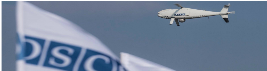
БПЛА дальнього радіуса дії