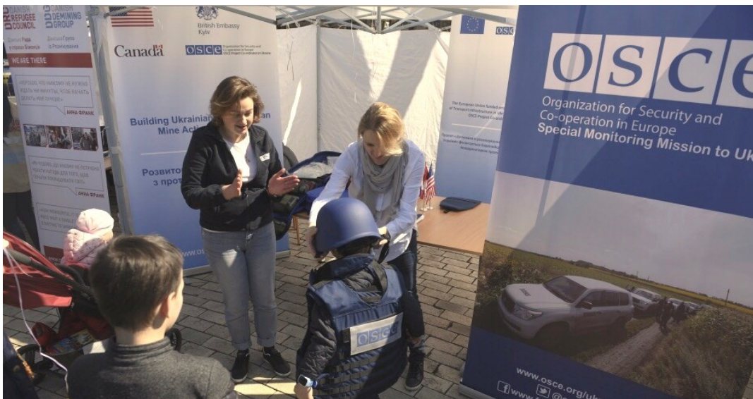
Співробітники СММ ОБСЄ та Координатора проектів ОБСЄ в Україні демонструють обладнання для розминування під час заходів із нагоди Дня просвіти щодо мінної небезпеки, Київ, 4 квітня.