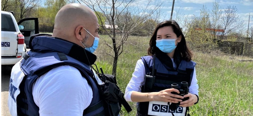
Спостерігачі СММ у Горлівці Донецької області