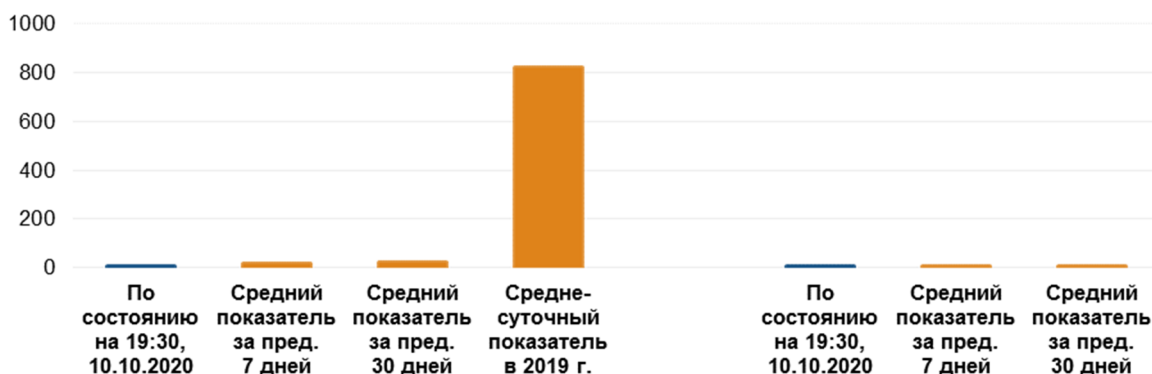
Количество зафиксированных взрывов 4