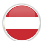
Пример 14 Национальный план действий Латвии на 2021-2023 годы