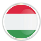
Пример 15 Национальный план действий Венгрии на 2020-2023 годы

Ниже приведен пример того, как эти вопросы отражены в НПД Венгрии.