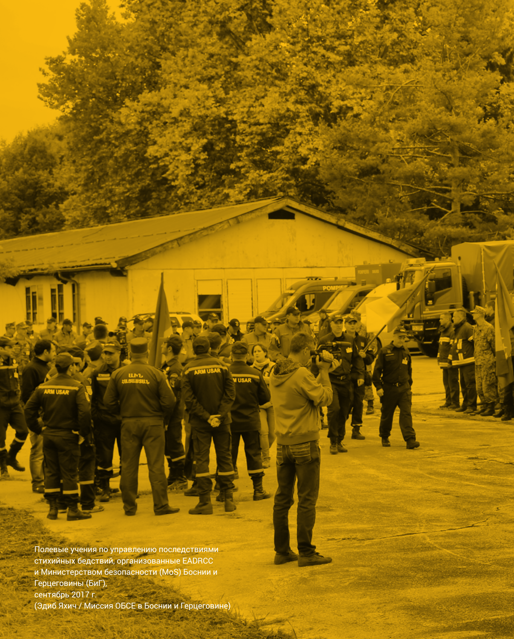
Полевые учения по управлению последствиями стихийных бедствий, организованные EADRCC и Министерством безопасности (MoS) Боснии и Герцеговины (БиГ), сентябрь 2017 г.