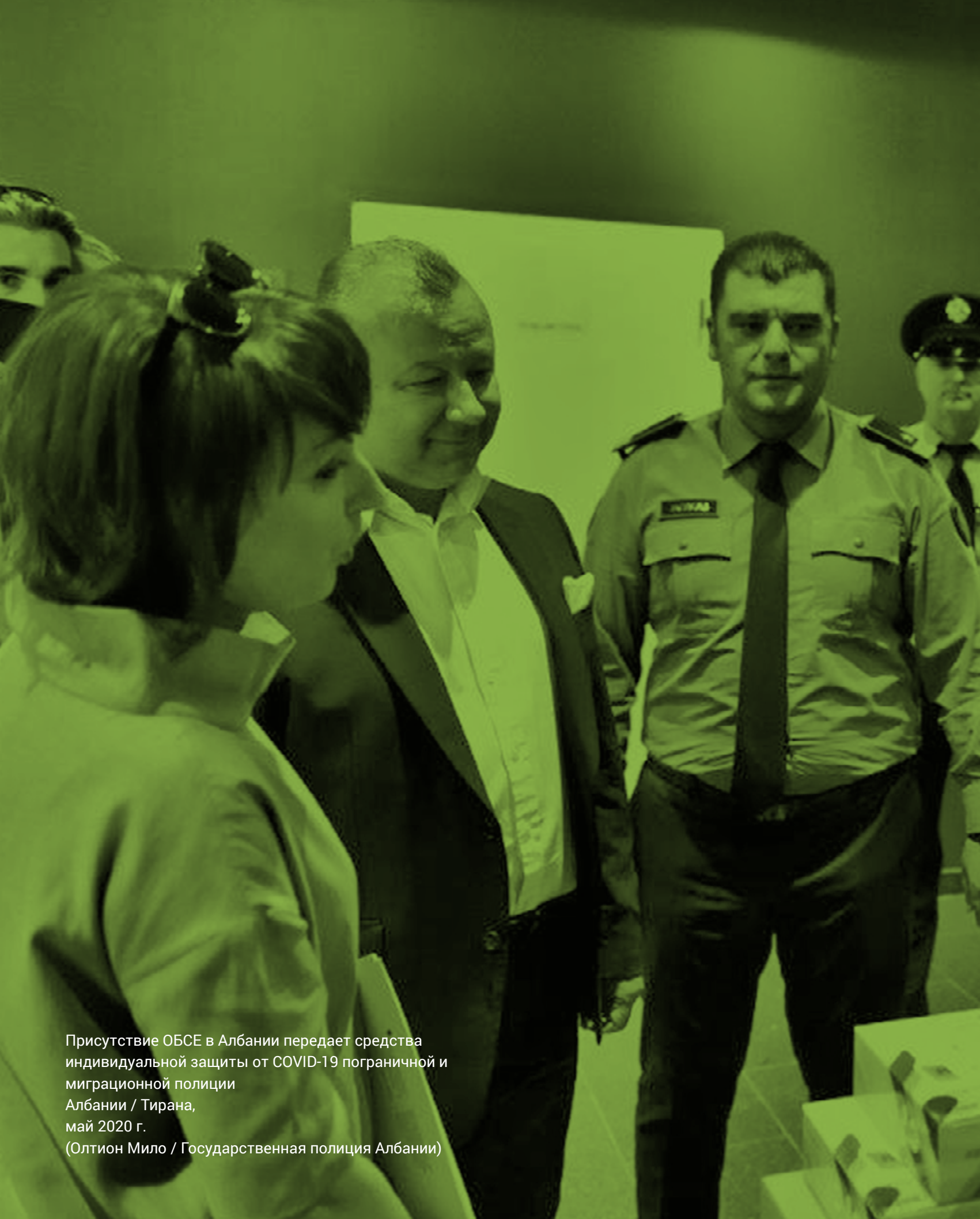
Присутствие ОБСЕ в Албании передает средства индивидуальной защиты от COVID-19 пограничной и миграционной полиции Албании / Тирана, май 2020 г.