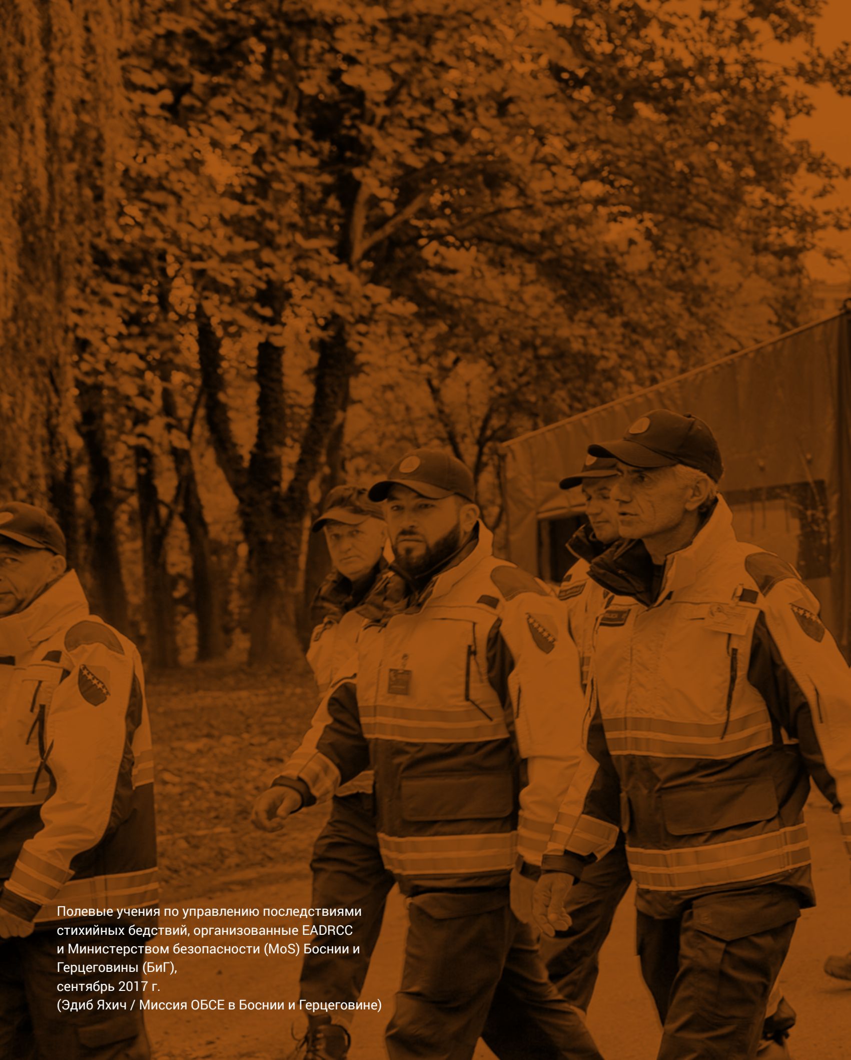
Полевые учения по управлению последствиями стихийных бедствий, организованные EADRCC и Министерством безопасности (MoS) Боснии и Герцеговины (БиГ), сентябрь 2017 г.