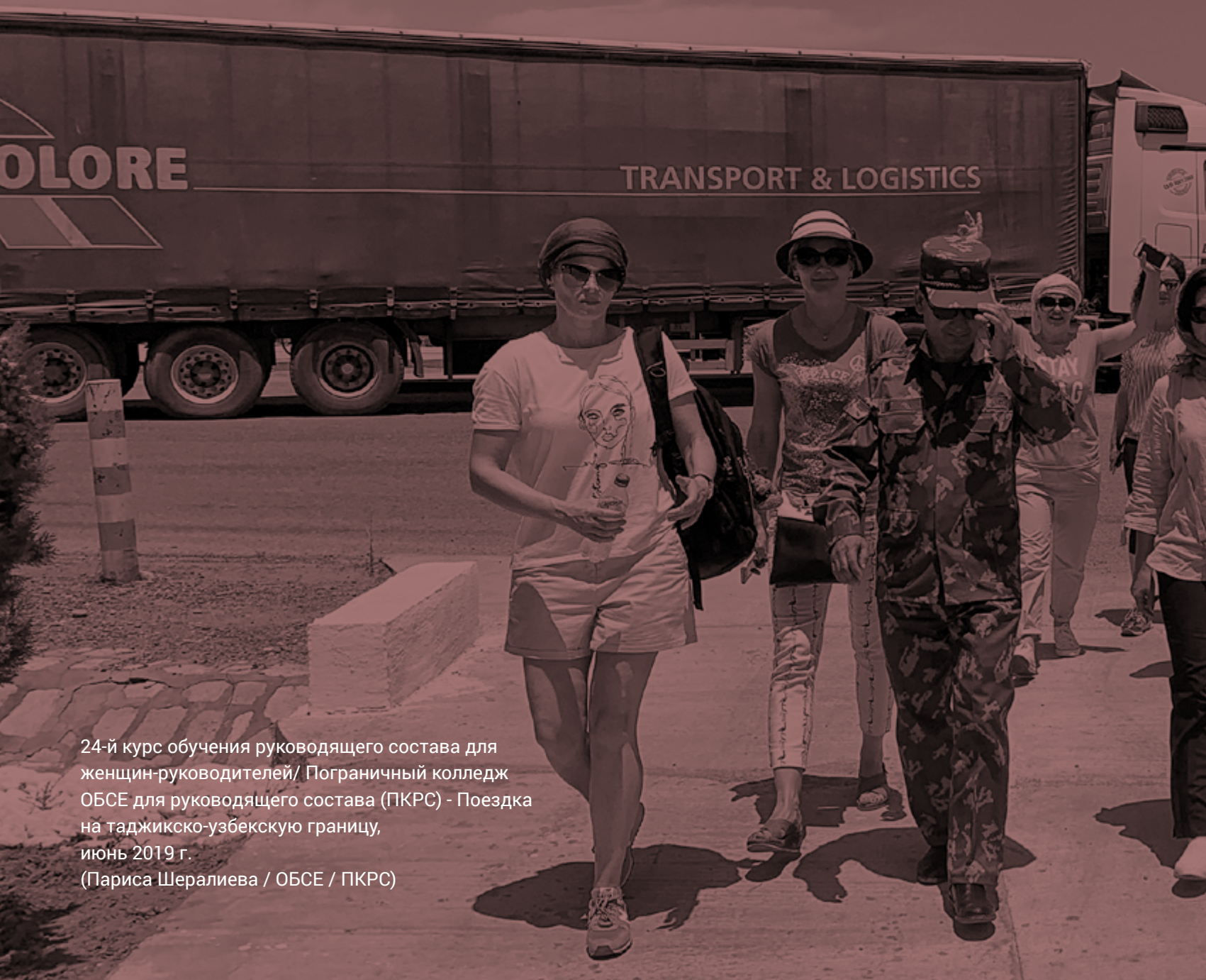
24-й курс обучения руководящего состава для женщин-руководителей/ Пограничный колледж ОБСЕ для руководящего состава (ПКРС) - Поездка на таджикско-узбекскую границу, июнь 2019 г.