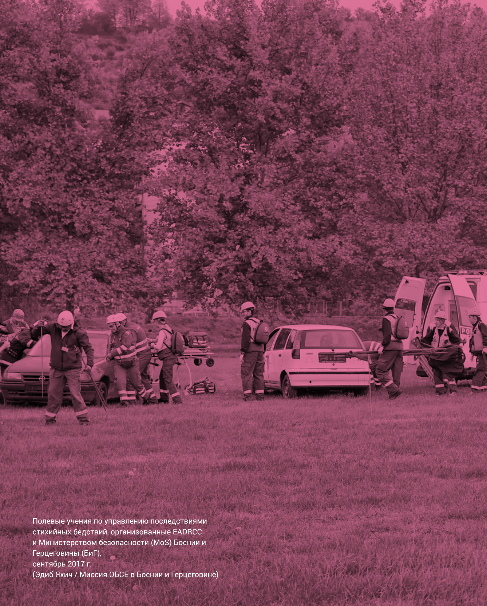
Полевые учения по управлению последствиями стихийных бедствий, организованные EADRCC и Министерством безопасности (MoS) Боснии и Герцеговины (БиГ), сентябрь 2017 г.