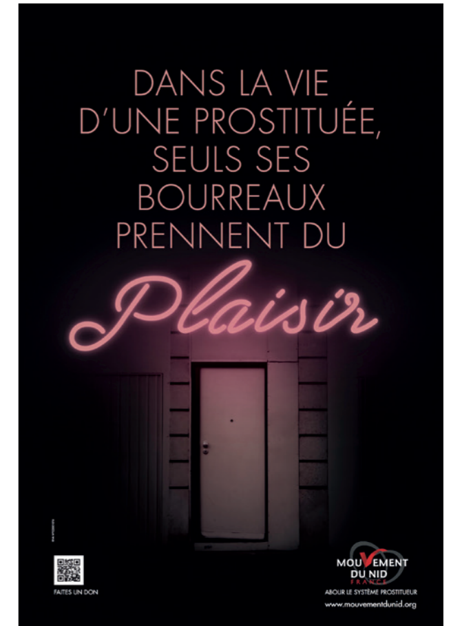
© Mouvement du Nid - Affiche Bourreaux (Движение Нид - плакат кампании «Мучители»)

кундного видеоролика. Видео можно было посмотреть в Интернете, а рекламная кампания была активна в городах по всей Франции, включая Мец, Брест, Лилль и Ниццу. 225