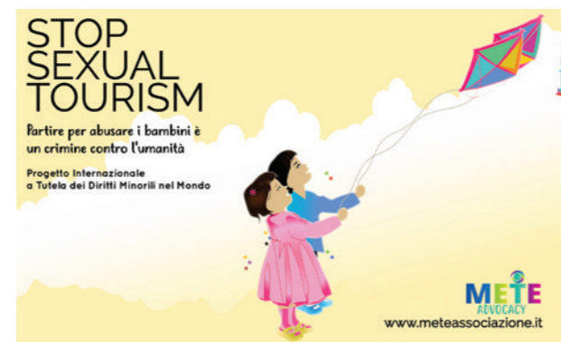
© Stop Sexual Tourism - Italy (Остановим секс-туризм - Италия)

В Словении деятельность была также направлена на транспортный и туристический секторы. В 2015 году ОГО Drogart организовала кампанию «Проституция — это не всегда выбор. Часто — это принуждение». Он был разработан для повышения осведомленности о ТЛ в целях сексуальной эксплуатации как среди клиентов, так и среди персонала в секторах туризма и транспорта. Конечная цель кампании состояла в том, чтобы дать возможность персоналу и клиентам распознавать случаи «принудительной проституции» и отговорить людей покупать секс в таких случаях. Используя образовательный веб-сайт, рекламные щиты в крупных городских районах, онлайн-рекламу, плакаты и другие рекламные материалы в барах, отелях и такси, месячная кампания была направлена на то, чтобы быть видимой для всех покупателей, в секторе туризма, гостиничного бизнеса и транспорта. 249