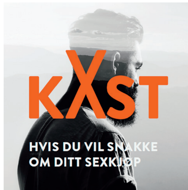
© KAST - Norway (KAST - Норвегия)

В Соединенных Штатах обучение покупателей осуществляется в рамках различных программ (в просторечии называемых «школами для клиентов проституток»). Примеры включают в себя «Программу для тех, кто впервые был задержан за покупку проституции» в Сан-Франциско («First Offender Prostitution Program») или «Прекращение сексуальной эксплуатации в Сиэтле» («Stopping Sexual Exploitation in Seattle»). 259 Некоторые из этих программ аналогичны образовательным программам для покупателей в Норвегии и Швеции в том смысле, что они являются добровольными, при этом мужчинам, арестованным за покупку секса, предоставляется выбор между судебным преследованием или посещением платных занятий. 260 Другие санкционируются судом как часть приговора после судебного преследования.