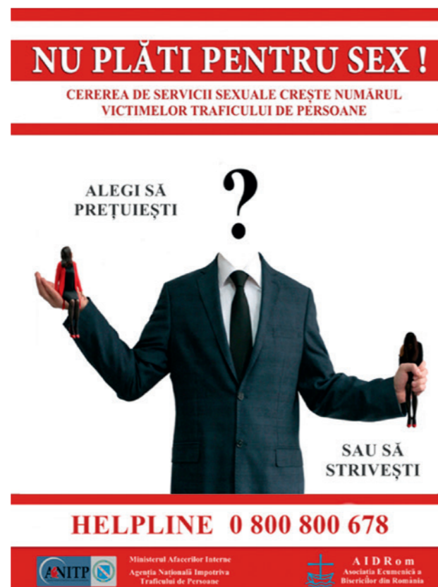
© ANTIIP Campaign - Romania (Кампания ANTIIP - Румыния)