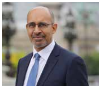
Представитель ОБСЕ по вопросам свободы СМИ Арлем Дезир

участие в борьбе с расизмом, антисемитизмом и другими формами дискриминации.