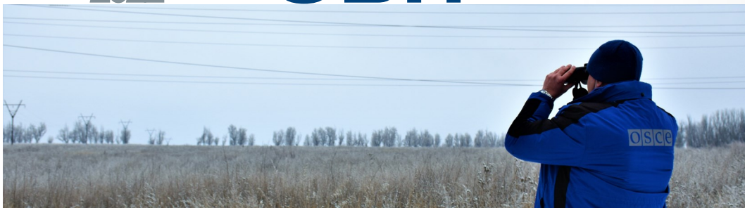
Патрулювання н. п. Світлодарськ, Донецька область (СММ ОБСЄ)