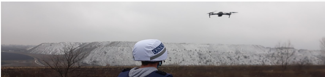
Патрулирование возле Северодонецка, Луганская область