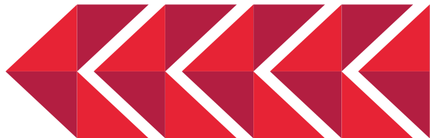
TABELA E PËRMBAJTJES