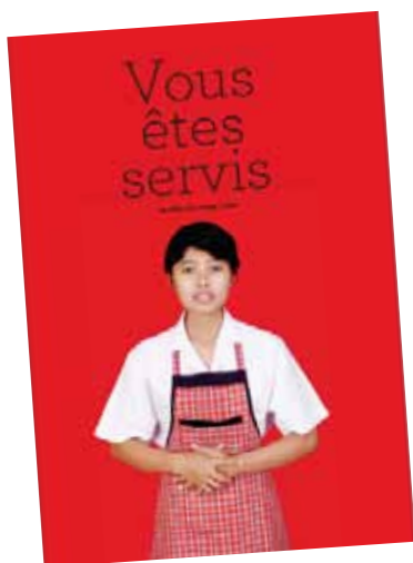
Фильм “Vous êtes servis” режиссера Жоржа Леона (2010)

Снятый в 2009 году в Джакарте (Индонезия), этот документальный фильм повествует о центре по трудоустройству, где женщины проходят профессиональную подготовку для работы прислужкой. В сопоставлении с движущимися кадрами, которые изображают различные моменты этой подготовки, показываются многочисленные фотоснимки. На их фоне читаются подлинные письма, раскрывающие подробности невыдуманных жизненных историй, где надежды многочисленных домашних работниц-мигрантов обеспечить экономическое благополучие семей на родине обернулись кошмаром, где они измождены работой или подвергаются жестокому обращению и низведены до рабского состояния.