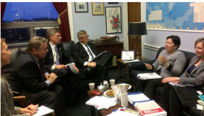
Специальный Представитель повышает общественную и политическую значимость борьбы с торговлей людьми путем сотрудничества с высокопоставленными государственными деятелями и законодателями во всем регионе ОБСЕ.

В 2013 году, ОБСЕ добавила к Плану действий четвертый раздел о партнерстве, подчеркивая необходимость более тесного сотрудничества с международными организациями и другими партнерами, в том числе по вопросам, касающихся правоохранительных структур, национального механизма передачи и рассмотрения дел (НМГП) и совместной работы между государственными ведомствами и частным сектором.