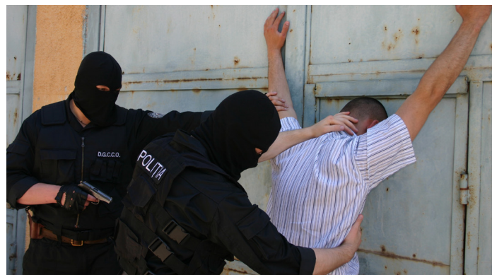
Бюро сотрудничает с международными правоохранительными организациями и членами Альянса против торговли людьми для борьбы с современным рабством.