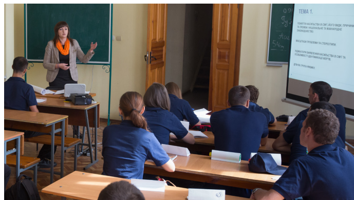
Бюро Специального Представителя тесно сотрудничает с другими институтами ОБСЕ и миссиями ОБСЕ на местах для решения задач по предотвращению и борьбе с торговлей людьми.