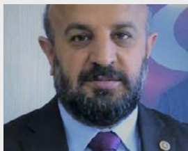
Мехмет Саит Киразоглу Депутат парламента Турции, член Комитета по миграции ПА ОБСЕ

«В Турции проживает самое большое число беженцев в мире – около 4 миллионов беженцев и лиц, ищущих убежище, в том числе 3,6 миллиона сирийцев. В одном только Газиантепе 9 , моем родном городе, расположенном у границы с Сирией, проживает более полумиллиона сирийских беженцев. Хотя мы говорим о числах, мы не должны забывать: все они люди, и жизнь каждого из них, без сомнения, представляет собой отдельный пример трагедии. Турция придает большое значение защите мигрантов, их интеграции и поддержанию их достоинства. Стигматизация, ксенофобия и дискриминация по отношению к людям, бегущим от опасности, незаконны, безнравственны и бесчеловечны. Это неправильный сигнал для будущих поколений».