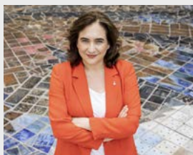
Ада Колау, мэр Барселоны (Испания)

«В Барселоне мы говорим более чем на 300 разных языках. У нас представлено более 180 национальностей и более 970 религиозных общин: многообразие всегда было и остается одним из главных богатств нашего города. С самого начала наша работа направлена на то, чтобы Барселона росла благодаря каждому из своих соседей, а они – вместе с городом, через признание многообразия и его наглядное присутствие, соблюдение прав человека и недопущения любых видов дискриминации».